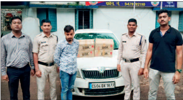
हरिभूमि न्यूज ►► राजनांदगांव