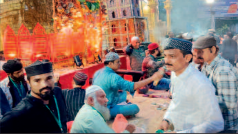
राजनांदगांव

हजरत इमाम हुसैन और कर्बला के शहीदों की याद में मोहर्रम की 10 तारीख को राजनांदगांव शहर में ताजिया बनाई गई। बारिश की वजह से शहर के अटल सैयद दरगाह के समीप सभी ताजिया को रखा गया था, जहां लोगों ने पहुंचकर ताजिया की जियायत की। प्रतिवर्ष मोहर्रम पर राजनांदगांव शहर में मुस्लिम तेली पंचायत द्वारा ताजिया बनाया जाता है।