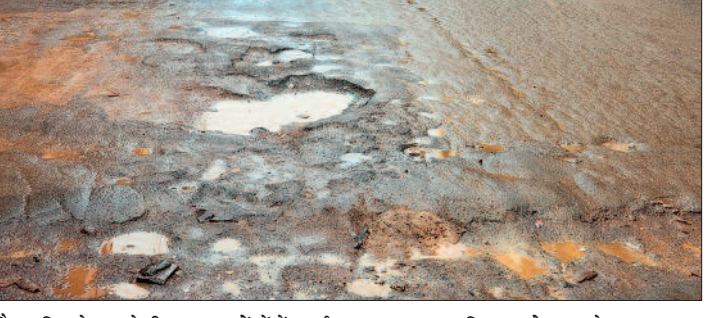
हरिभूमि न्यूज ►► राजनांदगांव

बारिश पूर्व राजनांदगांव शहर की सड़कों के गड़ों को भरने के लिए ध्यान नहीं दिए जाने के चलते बारिश का पानी सड़क के गड़ों में भरने लगा है। शहर के मुख्य मार्ग से लेकर वार्ड के भीतरी सड़कें काफी जर्जर नजर आ रहे हैं।