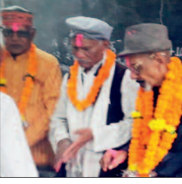
हरिभूमि न्यूज ►► राजनांदगांव

छग पेंशनर्स एसोसिएशन जिला व नगर इकाई तहसील शाखा की एक संयुक्त मासिक बैठक 14 जुलाई को दोपहर 12.30 बजे ठा. प्यारेलाल हायर सेकेंडरी स्कूल में संपन्न हुई बैठक में प्रांतीय महामंत्री समेत अन्य पदाधिकारी शामिल थे। प्रतिनरी द्वारा प्रांतीय महामंत्री का अभिनंदन व स्वागत किया गया।